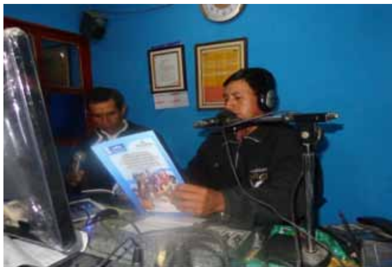
El sector campesino y las radios comunitarias apoyan la divulgación de la Política Nacional de Seguridad Alimentaria y Nutricional y la Ley del Sistema Nacional de Seguridad Alimentaria y Nutricional