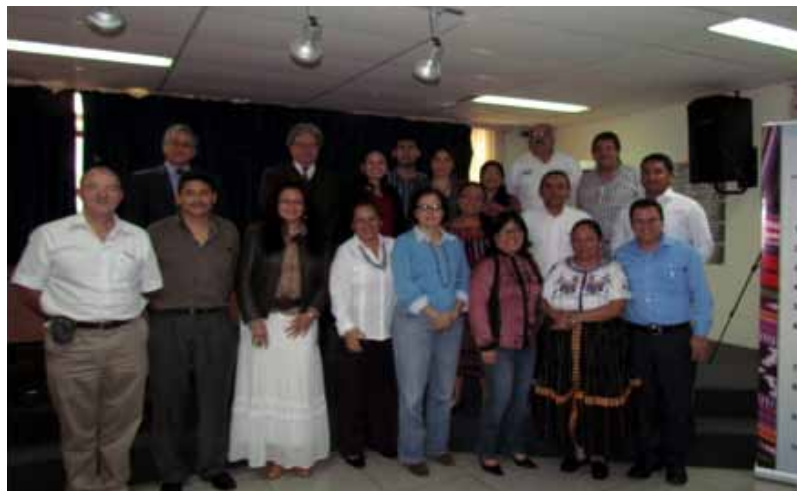
Participantes en el seminario INCOPAS, SESAN y otros sectores

En el seminario participaron 35 personas procedentes de Quetzaltenango, San Marcos, Chimaltenango y Ciudad Capital, y fue impartido por un especialista invitado y por representantes de la Facultad Latinoamericana de Ciencias Sociales –FLACSO-, con el apoyo de la Embajada de Canadá.