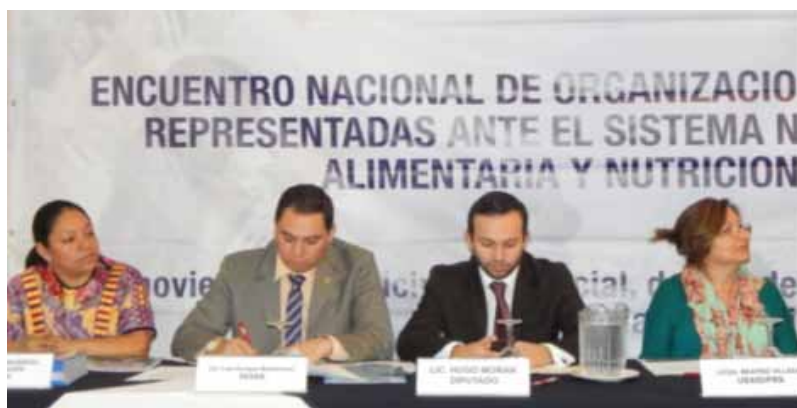
Integrantes de la mesa principal en la inauguración del III Encuentro

En el encuentro se realizaron dos paneles foro, mesas de trabajo para abordar avances, resultados de las acciones del Plan del Pacto Hambre Cero y los componentes que contemplan los temas de agua y saneamiento, agricultura y tierra, educación y salud y la Ventana de los Mil Días así como la vinculación de la INCOPAS con las demás organizaciones.