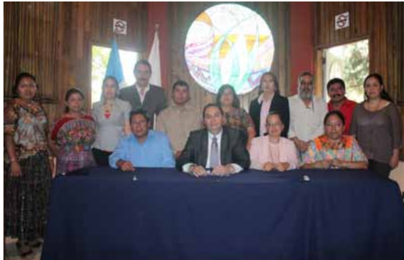
Integrantes de la INCOPAS 2013-2015